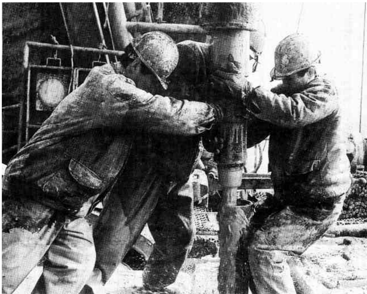
黄河钻井四公司坚持以经济效益为中心，积极开展技术创新和技术攻关活动，确保钻井生产的稳步发展。截至2002年12月25日，该公司全年共开钻267口，交井268口，进尺604479米，圆满完成了全年生产经营任务。图为该公司4583钻井队正在紧张施工。