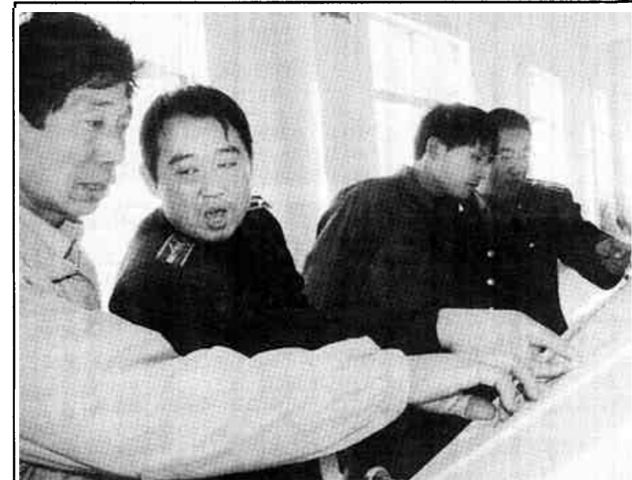
河口区质监分局努力作好自己的履行职能与服务经济建设相结合的文章，开展了干部与企业结对子活动，积极主动上门服务，及时解决企业经营中遇到的实际困难。图为该局工作人员到企业调研。

元旦、春节、九九老人节、中秋节等节日，都由站领导带队带上面粉、食用油、月饼等礼品，来看望老人们。站团支部的姑娘、小伙子们还利用休息日经常为老人梳头、洗脸、打扫卫生、整理房间，有时还给老人来上张特写或合影。去年“五一”节，该站又派出专车拉上老人们到天鹅湖公园游了一天，实现了好多老人的夙愿。老人们这样说：站里的同志比亲儿女还亲呢。（任晓芹 王培谦）