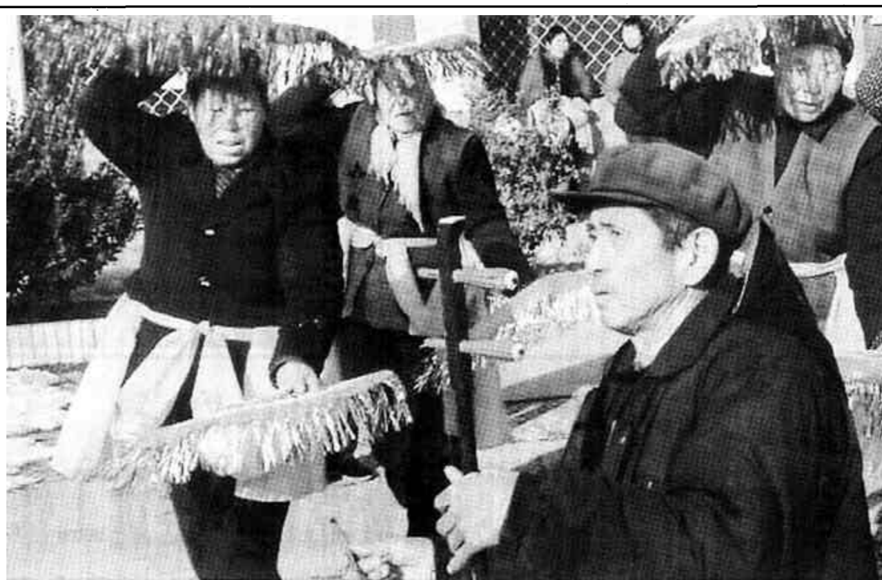
春节临近，广饶县稻庄镇刁炉村群众文化活动丰富多彩。他们创作了小板《党的十六大就是好》、舞蹈表演《献花篮》等节目，组织老年文艺队演出，深受群众的欢迎。（温冲平 徐大为 摄）

北宋镇每年都拨付一定数量的资金用于干部职工的短训、轮训，从而在整个机关内形成了浓厚的学习氛围。尤其是去年以来，为创建“学习型机关”，该镇加大了对转变政府职能作用重大的金融、财会等专业的学习力度，掀起了创建“学习型机关”的新高潮。该镇109名35岁以下青年干部、职工，第一学历大专以上学历的只有12人，通过近年来的学习和创建“学习型机关”活动的开展，目前已经有50人通过自学考试、函授等形式的学习取得了大专或本科学历，有15人正在进修学习中。（薄武军）